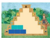
ПРИМЕР: СТАРТОВА ПОЗИЦИЯ