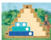
И да поставите плочките по този начин